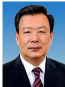
M. XIA Baolong, Gouverneur Depuis 2012