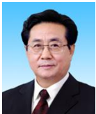
M. ZHAO Hongzhu, Secrétaire général PCC Depuis 2007